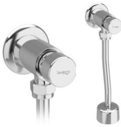
JANO-Torneira temporizada P\Urinol Ref.ª S5004913450710