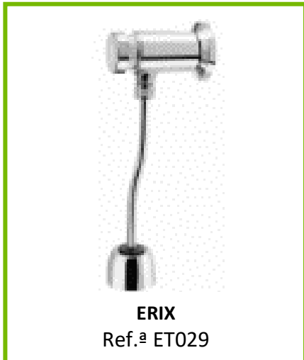
ERIX Ref.ª ET029