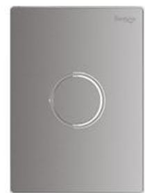
Fluxómetro de mictório Ref.ª S50087829299900