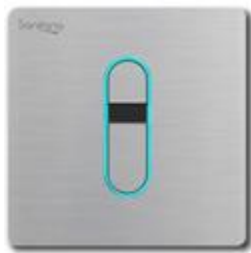
SETRON-Fluxómetro de mictório Ref.ª S50206200012600