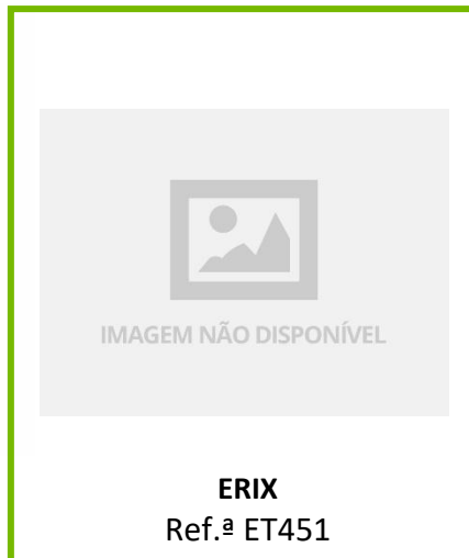
ERIX Ref.ª ET451