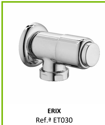
ERIX Ref.ª ET030