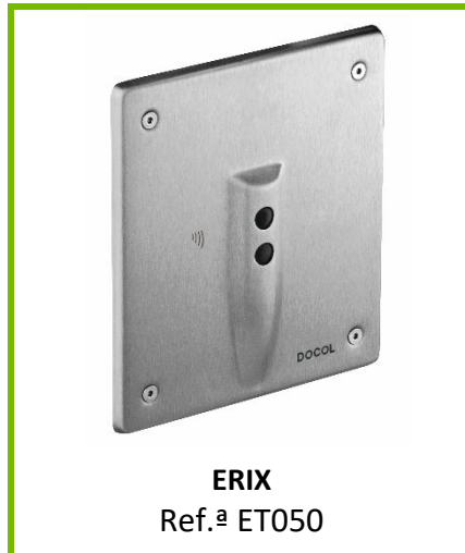
ERIX Ref.ª ET050