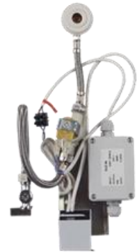
LARGE-Fluxómetro de mictório Ref.ª S10083062850700