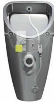
CAPRI-Fluxómetro de mictório Ref.ª H8430700004841