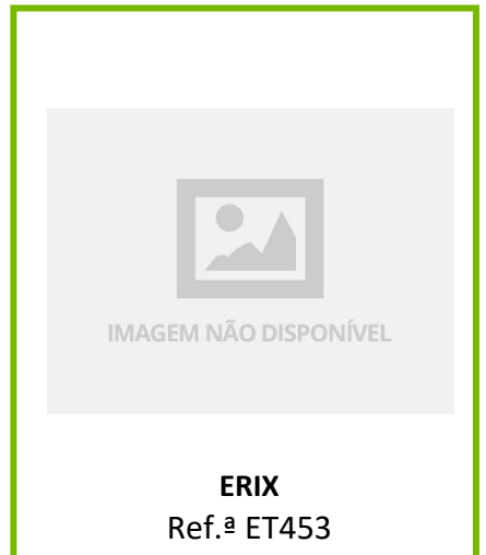
ERIX Ref.ª ET453