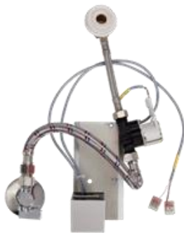
LARGE-Fluxómetro de mictório Ref.ª S10083162850700