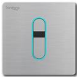
SETRON-Fluxómetro de mictório Ref.ª S50206200012600