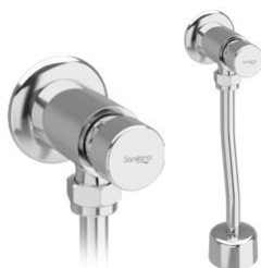
JANO-Torneira temporizada P\Urinol Ref.ª S5004913450710