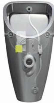
CAPRI-Fluxómetro de mictório Ref.ª H8430700004841