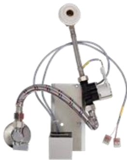
LARGE-Fluxómetro de mictório Ref.ª S10083162850700