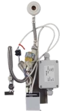
LARGE-Fluxómetro de mictório Ref.ª S10083062850700