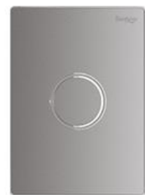
Fluxómetro de mictório Ref.ª S50087829299900